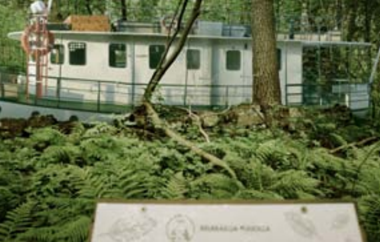
Illustrations of ferns and the text "BIBIACIA RUBRA" are visible on the sign.